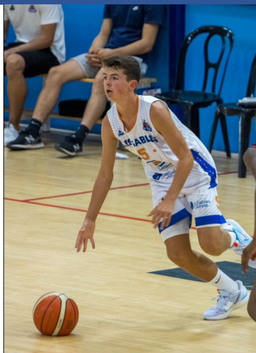
U17 Région / U18 Elite

Créé en 2014, le pôle performance a pour objectif d'accompagner ses joueurs au plus haut niveau. Avec un recrutement principalement au niveau régional, l'organisation, le contenu et le suivi ont pour vocation de mettre le joueur au centre du projet.