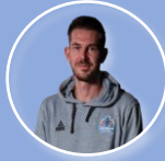
Formation du joueur