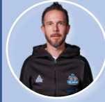
Suivi médical et Préparation physique

« Accompagner nos joueurs dans l'exigence du basket de haut niveau tout en veillant à leur intégrité et leur équilibre d'homme nous paraît indissociable. Rigueur/plaisir, Basket Ball/Étude et formation/performance sont les directions dans lesquelles nous nous efforçons de développer notre pôle »